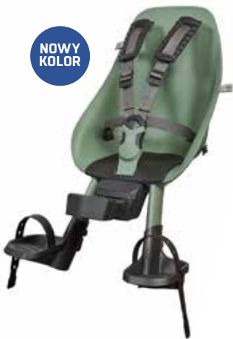
224163 green/ black