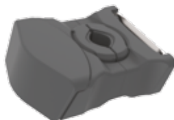
212399 Mocowanie przednie/Compact Adapter 95,90 zł