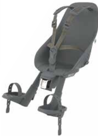
212665 black/ black