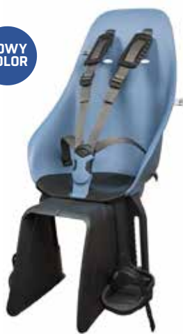
224200 blue/ black