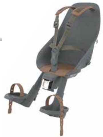
212672 black/ brown