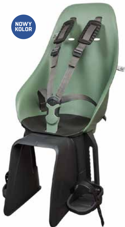
224194 green/ black