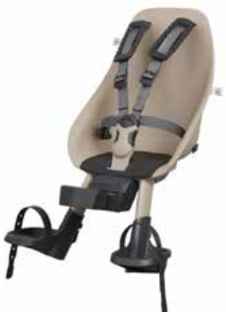
220585 beige / black