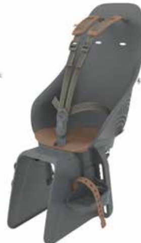
213877 black/ brown