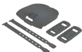
211644 Zestaw stylizacyjny przedni/Czarny 47,90 zł