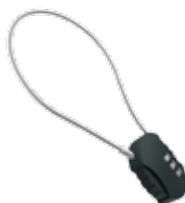
213105 Zapięcie fotelika przedniego 23,90 zł