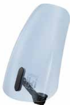
213709 Osłona wiatrowa/kolor Seiboku Gray 175,90 zł