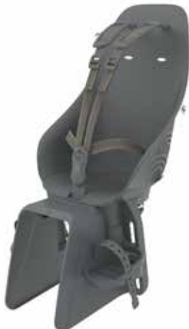
213860 black/ black