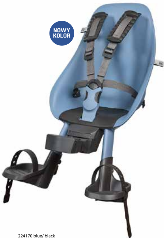
224170 blue/ black