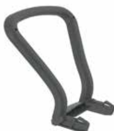
212382 Uchwyt przedni/kolor Bincho Black 47,90 zł