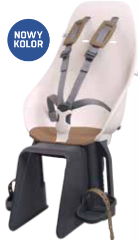
227607 pink/ brown