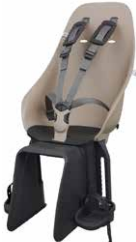
220592 beige / black